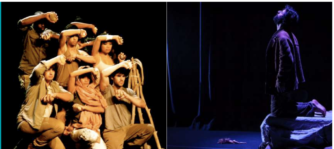
Foto de los espectáculos: Carícies de pedres i aigües y El rey del Gurugú