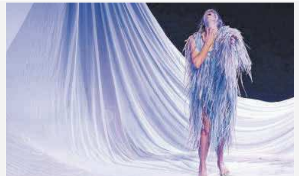
Un instant de l'espectacle «Com qui sent ploure».

Sobre l'escenari de la Sala La Planeta de Girona l'espectador s'hi trobarà quatre veus polifòniques sobre la necessitat d'aplicar unes lleis que perjudiquen el medi ambient, en favor de l'economia. «Estem davant d'un ecocidi, fruit d'una deixadesa, de no voler cuidar l'ecosistema i això que està