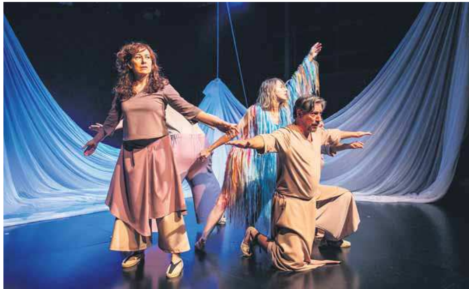
Una imatge de 'Com qui sent ploure', de David Martínez, que es representa aquesta tarda a La Planeta

► 3a edició Terra i Gastronomia, cicle gastronòmic per restaurants i establiments de cuina de Quart. Diversos restaurants del municipi serviran el Plat Tisserer 2023: carn a l'estil de les Gavarres adaptada al present per l'Escola d'Hostaleria i Turisme de Girona. Restaurants: Can Mascort, Arrels, La Parada (local social), Ca l'Àngel i L'Atuell. Fins al 29 d'octubre.